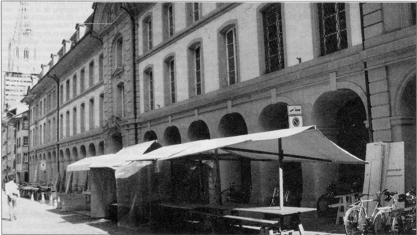
Aussenaufnahme von der Münstergasse mit «Märit-Ständen»

Beim Gebäude, das die StUB seit 199 Jahren beherbergt, weist äusserlich nichts darauf hin, dass sich darin eine Bibliothek mit 1,7 Millionen Bänden verbirgt. Versuche, durch Anschriften und Vitrinen auf unseren Betrieb aufmerksam zu machen, scheiterten mit einer Ausnahme an Einsprachen der Denkmalpflege und des städtischen Bauinspektorats.