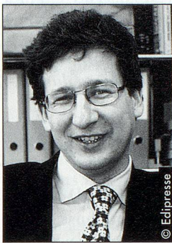
Von Stephan Holländer, Basel