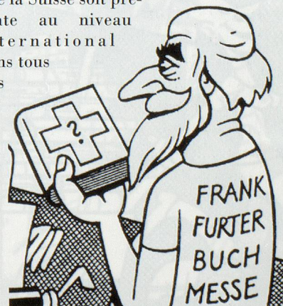
Dessins: Peter Gerber

C'est pourquoi, avec quelques suisses présents à l'IFLA de Copenhague, nous avons pensé qu'il était important de créer, au niveau de notre association professionnelle, un groupe de travail qui organise de manière plus structurée notre présence dans les colloques et les congrès à l'étranger pour que la Suisse soit présente au niveau international dans tous les