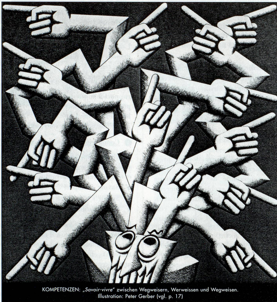
KOMPETENZEN: „Savoir-vivre“ zwischen Wegweisern, Werweisen und Wegweisen.