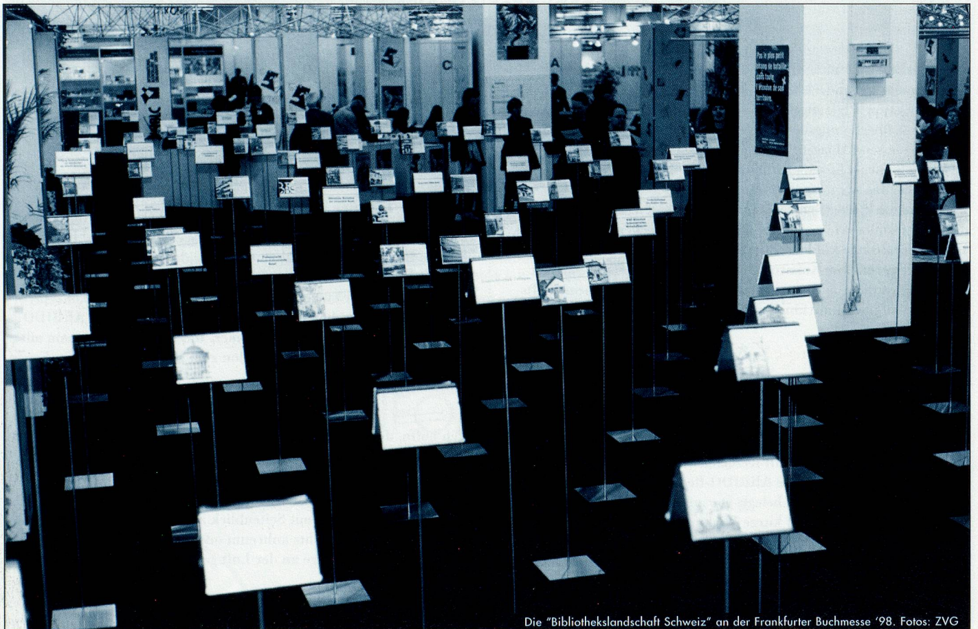
Die "Bibliotekslandschaft Schweiz" an der Frankfurter Buchmesse '98.

Es ist jedoch üblich, dass die Bibliotheken des jeweiligen Gastlandes sich in einem Sonderbereich der Messe, dem von der Stadt- und Universitätsbibliothek Frankfurt seit