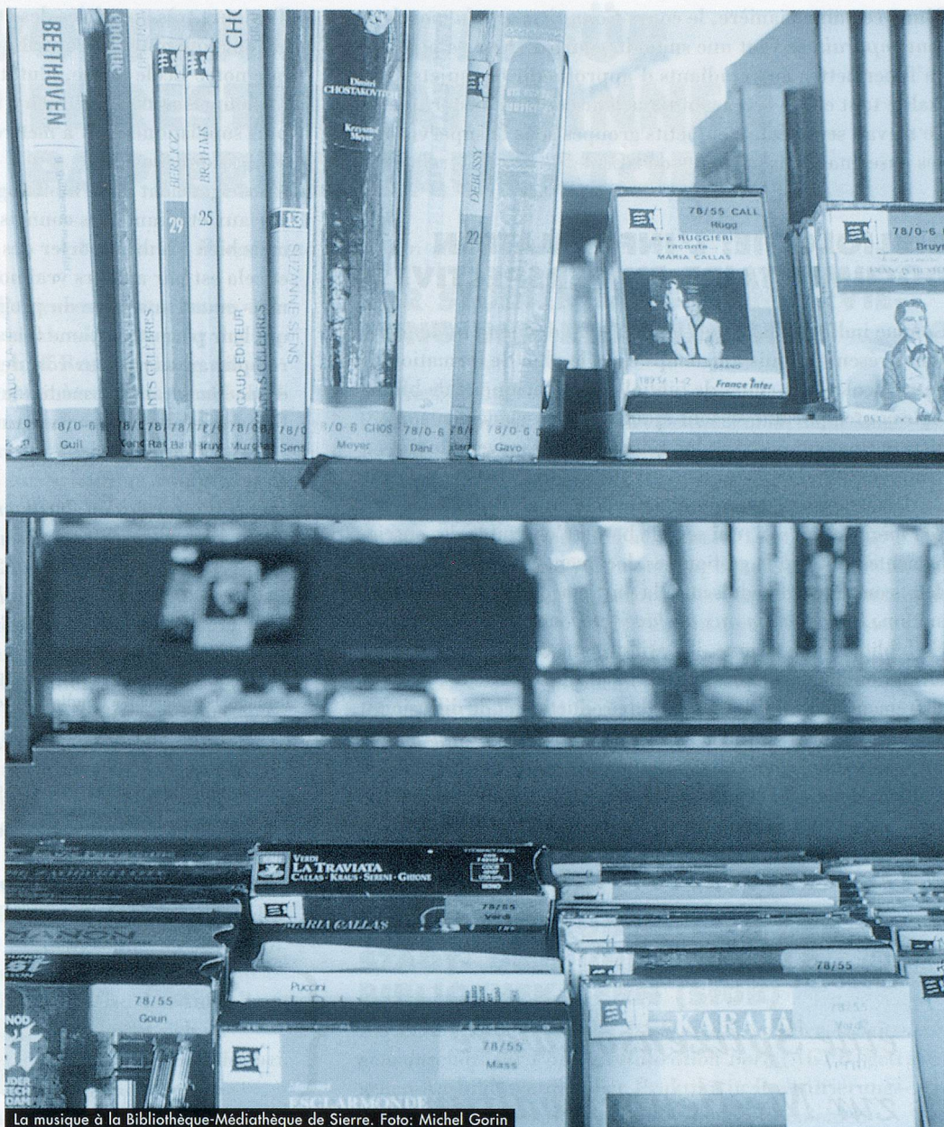
La musique à la Bibliothèque-Médiathèque de Sierre.