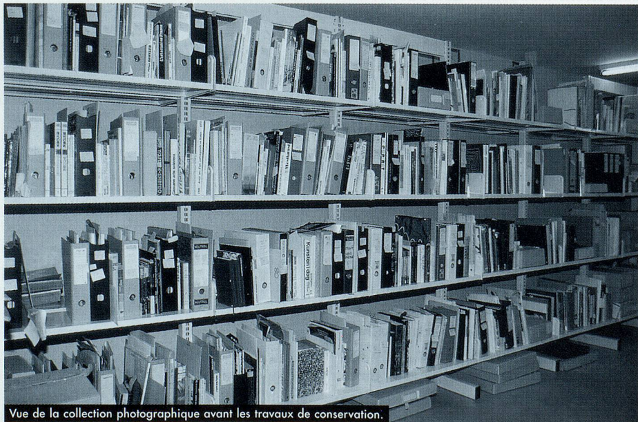
Vue de la collection photographique avant les travaux de conservation.

Schwerpunktthema der Jahre 2000/2001 ist die Fotokonservierung. Durch gezielte Weiterbildungskurse und in Zusam-