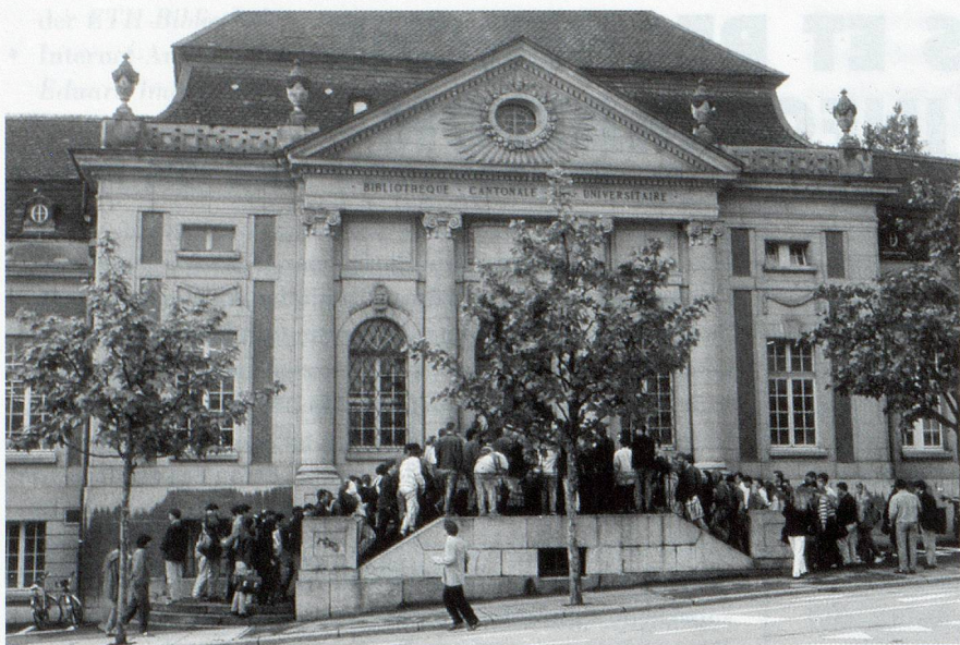
La bibliothèque reste le lieu privilégié pour l'accès démocratique à l'information (La BCU de Fribourg. Photo de Alex E. Pflingstag)