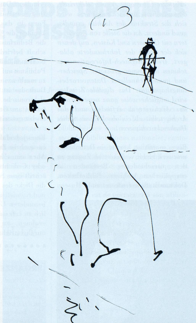
Gunter Böhmer: Zeichnung für die Taschenbuchausgabe von Thomas Manns «Herr und Hund». Zum 80. Geburtstag von Thomas Mann am 6.6.1955.

Die Bewahrer des literarischen Erbes sind derzeit mit tief greifenden Veränderungen konfrontiert. Denn inzwischen schreiben viele Schriftsteller ihre Texte nur noch auf dem Computer. Handschriftliches wird kaum noch produziert, unterschiedliche Textfassungen, vielleicht sogar auf verschiedenfarbigem Papier wie bei Lion Feuchtwanger, gibt es nur noch selten. Alles ist einem ständigen Veränderungsprozess unterworfen. Computer und Internet verändern aber auch die Lesegewohnheiten des Publikums und haben Auswirkungen auf die Erschliessung und Sicherung von literarischen Nachlässen, vermutet Aleida Assmann in ihrem kürzlich erschienenen Buch «Erinnerungsräume»: