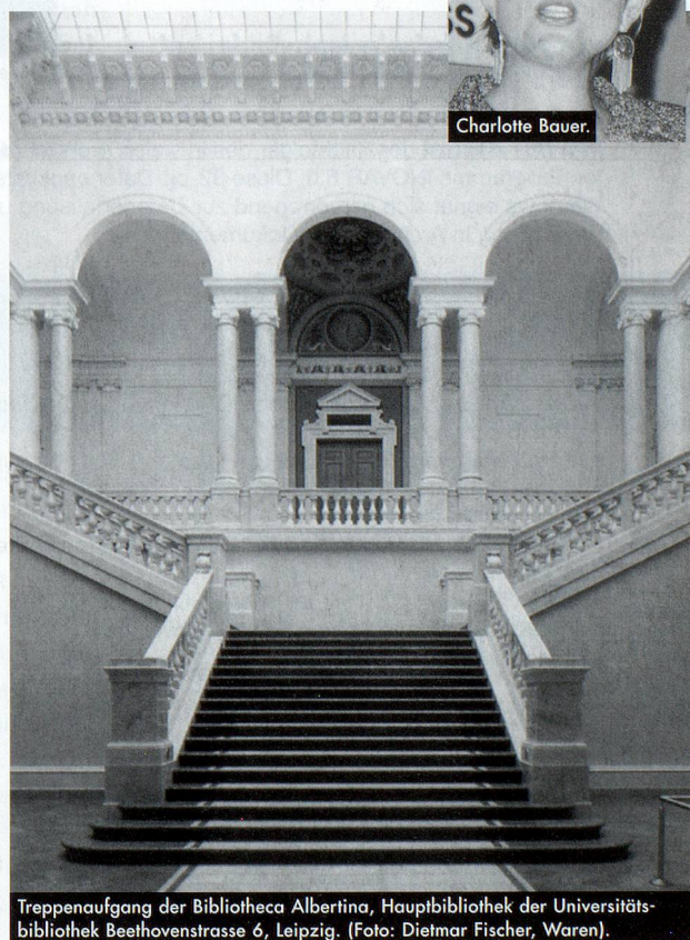
Treppenaufgang der Bibliotheca Albertina, Hauptbibliothek der Universitätsbibliothek Beethovenstrasse 6, Leipzig.