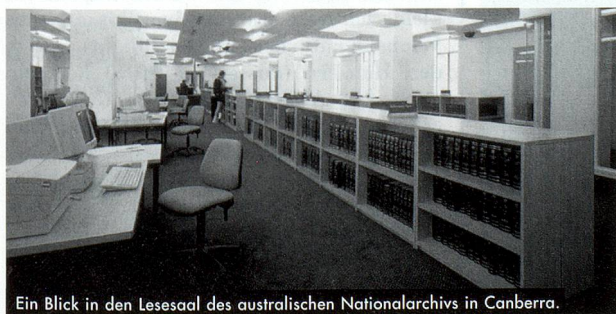
Ein Blick in den Lesesaal des australischen Nationalarchivs in Canberra.