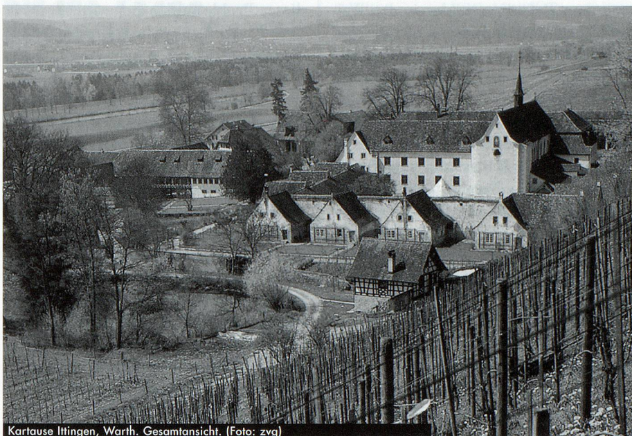
Kartause Ittingen, Warth. Gesamtansicht.

Im Laufe einer nachfolgenden längeren Diskussion schälte sich heraus, dass die Orientierungsrichtungen sowohl der Berufsbilder als auch der Verbände noch unklar sind, dass aber im Bereich der gemeinsamen Elemente (ARBIDO, Aus- und Weiterbildung) so oder so ein Annäherungsprozess stattfindet, über den die zukünftigen Rollen näher definiert und auch praktiziert werden. Falls dieser Prozess gelingt, dürften der Name und die entsprechende Organisation eine Folgeerscheinung sein. Denkbar sind Teilschritte wie ein gemeinsames Sekretariat und mehr Kooperation in der Weiterbildung. In der dreiteiligen Schlussabstimmung wurden die sofortige Änderung