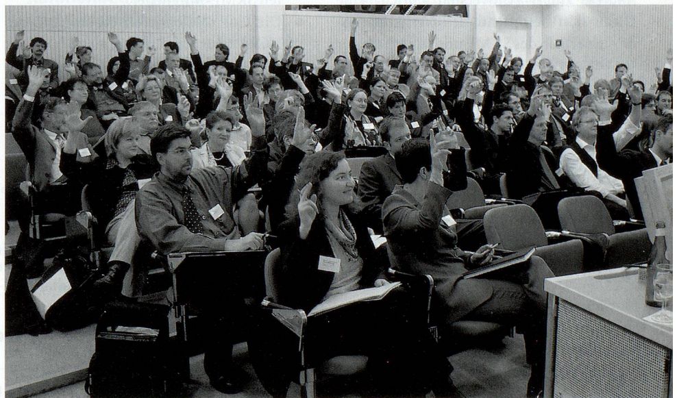
Gründungsversammlung des SKMF am 30. Januar 2002 in Zürich.

Neben dem Gründungsakt stellten verschiedene CoP's ihre Aktivitäten und Zielsetzungen vor. Nach dem Lunch erfolgte eine kurze Einführung in die elektronische Plattform Livelink des SKMF. Darauf erhielten die Teilnehmer Gelegenheit, im