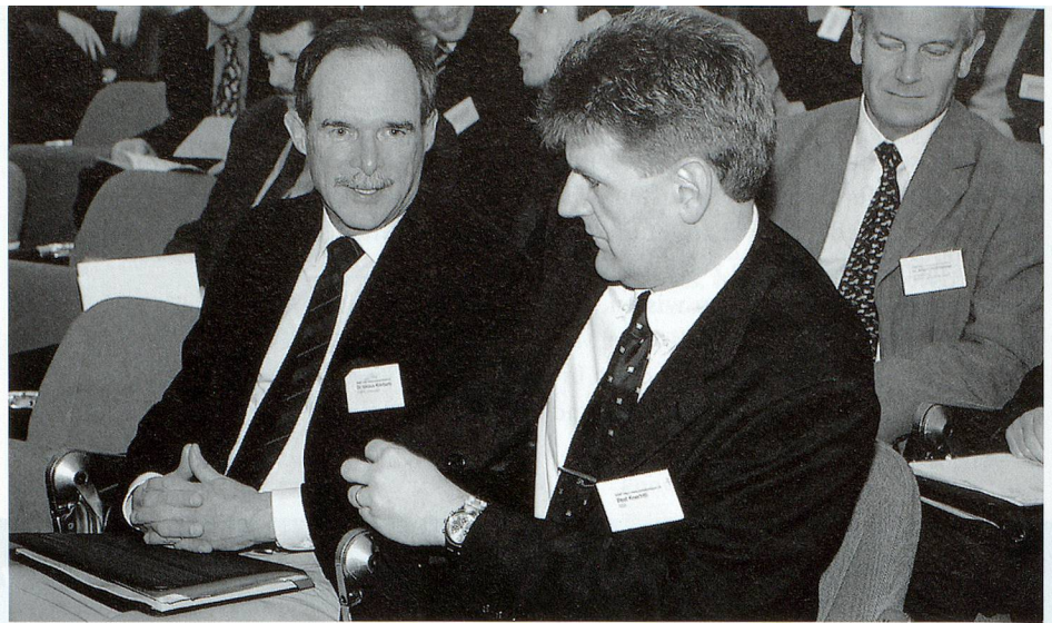
Wie Kontakte Knowledge fördern können.

Free-flow-Verfahren bei den einzelnen CoP's im Sinne eines Marktplatzes vorbeizuschauen, um Ideen und Erfahrungen auszutauschen und Kontakte zu knüpfen.