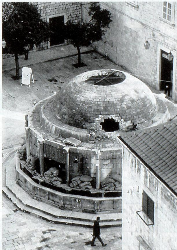
Kriegsschäden an Kulturgütern in Dubrovnik.

Unter dem Einfluss der kriegerischen Ereignisse im ehemaligen Jugoslawien rückte der Kulturgüterschutz vor ein paar Jahren wieder stärker ins öffentliche Bewusstsein, und er hat mittlerweile sogar eine brennende Aktualität erlangt (Afghanistan, Israel). Es hat sich dabei gezeigt, dass in einem Krieg des öfters bewusst Kulturgü-