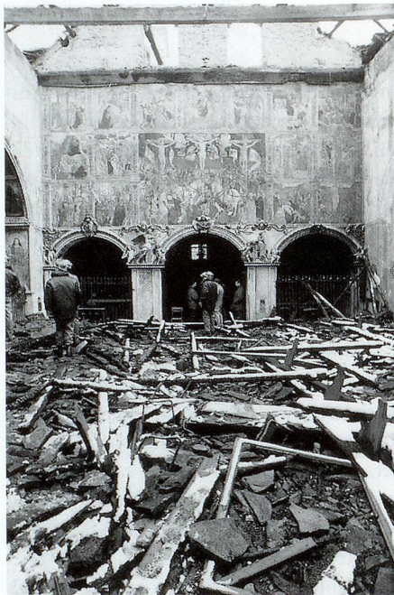
Die Kirche Santa Maria delle Grazie in Bellinzona (TI) wurde durch einen Brand schwer beschädigt.