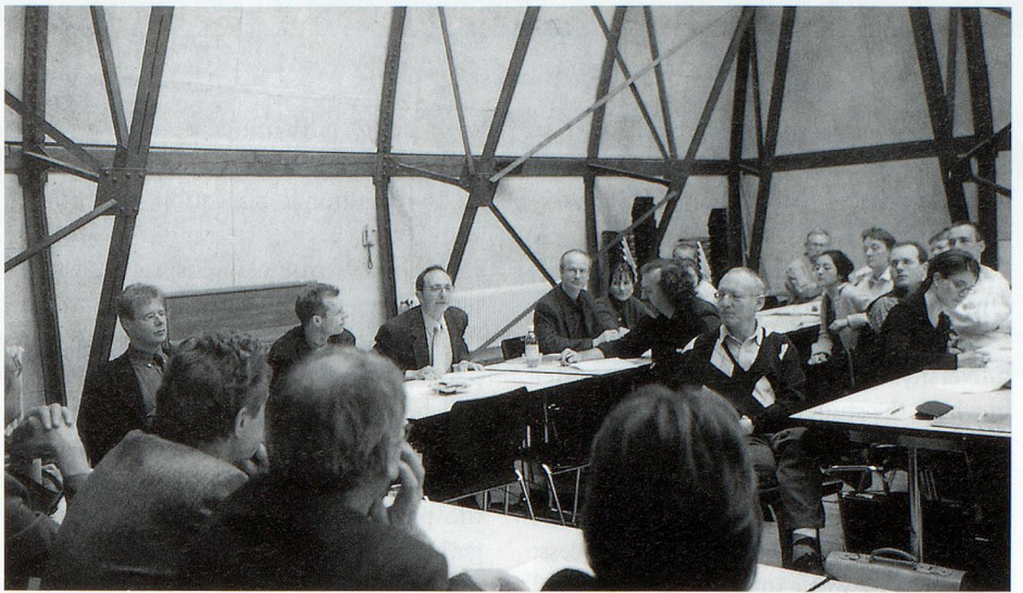
Aufmerksames Publikum an der VSA/AAS-Ausbildungs-Spezialtagung am 12. April 2002 in Bern.

In the years following these arrangements the Archives School came to realize the payoffs as well as the pitfalls of the revolution of 1995.