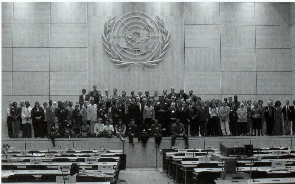
3.-4. novembre 2003: Pré-Sommet IFLA/WSIS – Les bibliothécaires à l'ONU, Genève.

Arbido -Titelbild bewundert werden kann. Das Buch «EINFACH» (ISBN 3-7296-0667-0) ist im Zytglogge Verlag (Bern/Oberhofen) erschienen, umfasst 76 zum grossen Teil auch farbig bedruckte Seiten mit köstlichem Inhalt und in kostbarer Ausstattung und wird hier mit schmetterlingshaft voreiligen Frühlingssgrüssen herzlich empfohlen von dlb . Contact: www.pfuschi-cartoon.ch