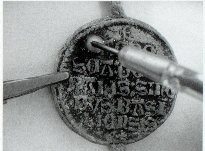
Elektrolytischer Restaurierungsprozess mit Platinanode.