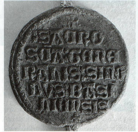
Bulle restauriert, die Bleisalze sind wieder in Bleimetall umgewandelt.

La version française de ce texte est disponible sous www.adhoc.ch/Giovannini