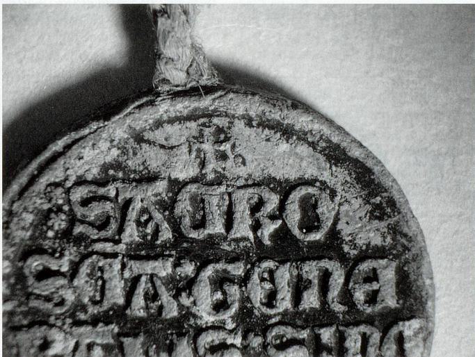
Bleibulle beschädigt (Stadtarchiv Biel, CXXVII.188, 1438).

1987 schlägt J. Fernandez eine Behandlung vor, bei der nur mit einem Tropfen elektrolytischer Lösung und mit einer speziell gebauten Platinelektrode gearbeitet wird. Die verwendete Lösung ist eine sehr stark verdünnte Schwefelsäure (0.1M), die den chemischen Prozess eingetriggt und die Bildung einer schützenden Bleisulfatschicht fördert. Nach der Behandlung werden die Reste der Lösung sorgfältig gewaschen.