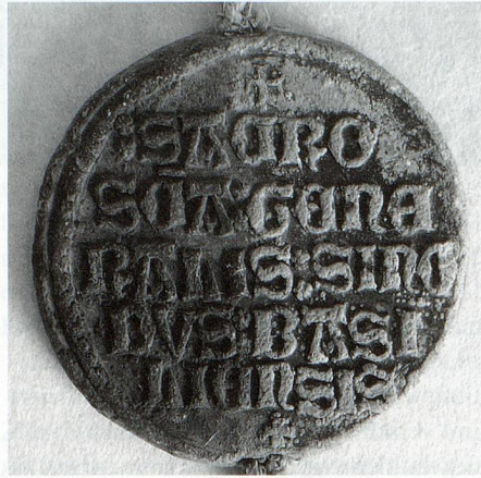
Bulle halb bearbeitet (links).

Nach der Behandlung wird die Bulle sorgfältig gewaschen und getrocknet; nach einer Woche wird die Oberfläche wieder kontrolliert und mit einer sehr dünnen,