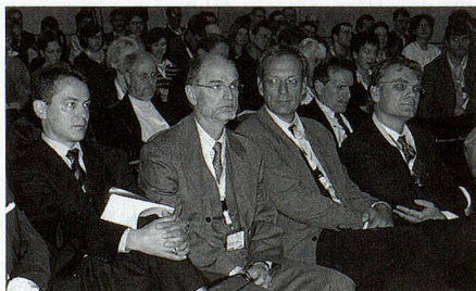
Chefs – présidents – auditoire.

L'organisateur principal, la Hochschulverband für Informationswissenschaft (HI) a pu réunir les associations suisses telles que