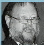
■ Urs Naegeli ASD