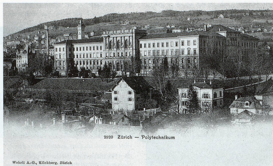
Zum 150-Jahr-Jubiläum der ETH Zürich werden die Schulratsprotokolle online publiziert.

Die neu aufgeschaltete Lösung ( www.sr.ethbib.ethz.ch ) eröffnet dem Nutzer zahlreiche und umfassende Recherchemöglichkeiten, wie etwa das Browsen über einen