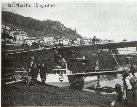
Wasserflugzeug auf dem St. Moritzersee, ca. 1915 (das Flugzeug konnte nicht mehr starten und musste auseinander gebaut werden, da der See zu kurz war).