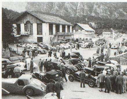
Sechs Mal fanden am Malojapass zwischen 1938 und 1952 nationale und internationale Automobil-Bergrennen statt.

dien vorgelegt. Die einen sammeln ganze Nachlässe und erschliessen diese, andere wiederum funktionieren mit einer Systematik. Hauptsache ist die Öffnung der Institutionen, damit diese interessanten Dokumente nicht im stillen Kämmerlein gesammelt und gehortet werden, sondern