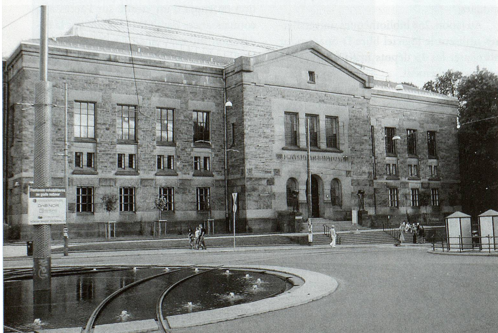
Norwegens Nationalbibliothek in Oslo.

Das «Gedächtnis der Nation» mit seinen zwei Standorten verfügt über ein jährliches Budget von gut 40 Millionen Franken.