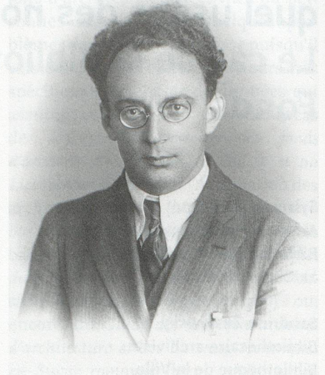
Portrait de Jules Humbert-Droz (Fonds Jules Humbert-Droz).

bibliothécaire 3 , avec pour objectif d'élaborer une grille de description archivistique et de tester un logiciel d'analyse. Dans le cadre de ce travail, afin de connaître ce qui se faisait déjà ailleurs en la matière et pour définir clairement ce que devrait contenir cette base de données, il a visité les Archives littéraires suisses à Berne et la Bibliothèque cantonale et universitaire de Dornoy. Tandis que les premières ne cataloguaient en ligne leurs archives qu'au niveau du fonds, la deuxième utilisait le logiciel File Maker Pro. Ensuite, un premier développement informatique a été accompli en interne sur le logiciel Access, mais il a montré rapidement ses limites puisqu'il était développé au moyen de la fonction «assistant»,