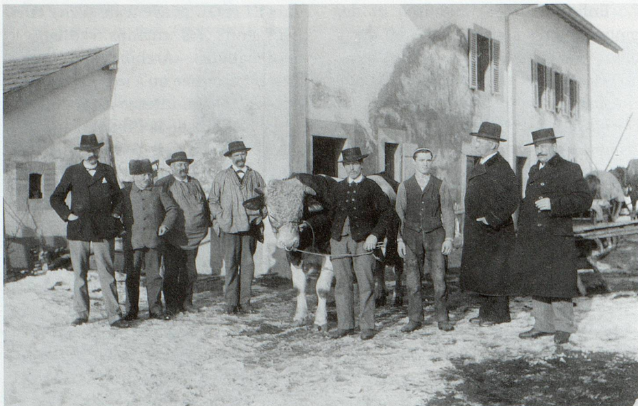
Photographie de membres de la Société d'agriculture (Fonds Société d'agriculture du district de La Chaux-de-Fonds).

des civilistes. L'information donnée par la description peut à tout moment être modifiée, précisée ou revue en fonction d'une connaissance plus précise du contenu des fonds ou d'un besoin nouveau.