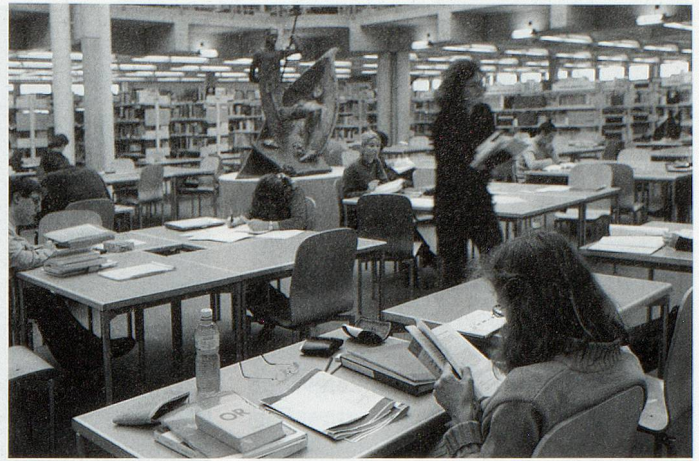
Universität St. Gallen: Lernplattformen entwickeln sich immer deutlicher zur zentralen Anlaufstelle der Studierenden für die Lehre. Eine direkte Verlinkung von der Lernplattform auf die Kurslektüre oder weiterführende Literatur in der Bibliothek kann die Studierenden zu einer vertieften Auseinandersetzung mit den Ressourcen der Bibliothek anregen und dem Trend zur Google-Suche entgegenwirken.