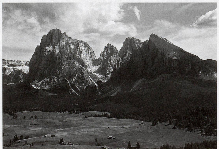
La montagne: de l'image au concept. Le Sassolungo, massif des Dolomites, Italie.

De nombreux historiens ont montré que la catégorie du «montagnard» devait bien peu à ses représentants mais beaucoup au discours philosophique et naturaliste du XVIII e siècle. Cette identité, naturalisée, connaît une forte diffusion dans les sociétés modernes à la faveur du développement de la littérature populaire et touristique, et des travaux de vulgarisation, notamment pour les publics scolaires. Le «montagnard», tout comme d'ailleurs les «ouvriers», la «bourgeoisie» ou les «paysans», a donc