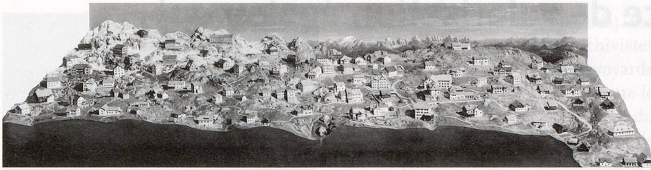
«Die verlorene Stadt»: Relief mit Modellen der enteigneten Schutzhütten des Alpenvereins in Südtirol. In der NS-Zeit musste es aus politischen Gründen aus dem Museum entfernt werden, vermutlich wurde es bei einem späteren Bombentreffer zerstört. Erhalten blieb nur diese Aufnahme aus den 1930er-Jahren.

Laufend werden grössere Teile der Akten digitalisiert und Objekte fotografiert.