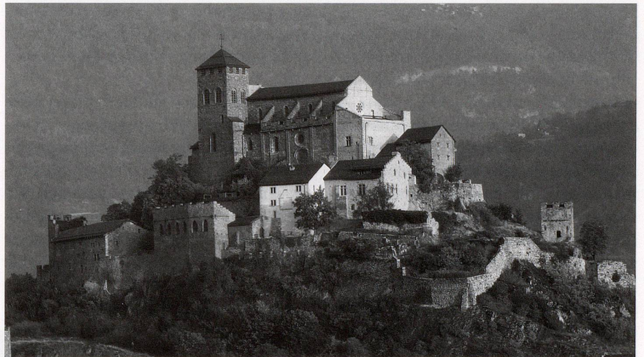
Le Musée d'histoire du Valais occupe les anciennes maisons capitulaires du château de Valère, à Sion

Au niveau cantonal, l'Association valaisanne des musées, fondée en 1981, a été un instrument important de rencontre entre «conservateurs» de milice, les musées cantonaux servant dans ce cas de modèles de référence. L'association a aussi tenté d'éviter la multiplication d'institutions semblables, en militant pour une complémentarité qui n'a pas toujours été comprise dans un canton où, entre 1975 et la fin du XX e siècle, le nombre de musées est passé de 25 à plus