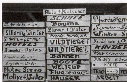
Viel Arbeit: fotografischer Nachlass in Bearbeitung.

Einmalig ist die Recherche in der Bilddatenbank, die online zugänglich ist. Sie umfasst rund 13000 Bilder, die systematisch erfasst und erschlossen sind. Die Bilder sind eine ausserordentlich reiche Quelle für unterschiedlichste Forschungs- und Publikationszwecke. In Zusammenarbeit mit dem Institut für Medienwissenschaften der Universität Basel wird die Datei momentan überarbeitet und die Funktionalität verbessert.