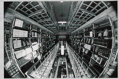
La Bibliothèque du Parlement en quelques mots

A première vue cela peut s'apparenter à un appauvrissement des fonds et