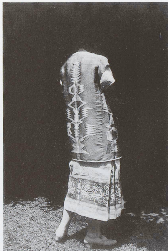
Stoffe disegnate da Georgette Klein

Oggi la casa è abitata da una coppia di artisti che hanno appena avuto una figlia e che ci vivono modestamente come avevano fatto a loro tempo le sorelle Klein. (L.M.)