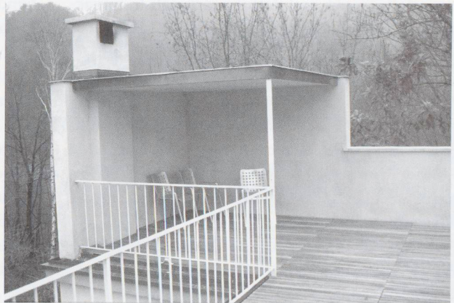
Dettaglio del terrazzo

Protetta dagli agenti atmosferici con il rifacimento del tetto e delle facciate, funzionale grazie ad una nuova centralina di riscaldamento e a un nuovo impianto elettrico, è stata rinnovata nei suoi colori originali (su ricerca dell'artista Thomas Rutherford) e conservata in tutti gli altri suoi elementi, serramenti in ferro compresi. Con le facciate che hanno ritrovato il loro colore originale giallo intenso, e con il tetto impreziosito da un pavimento in legno, luogo privilegiato di un'architettura di grande qualità.