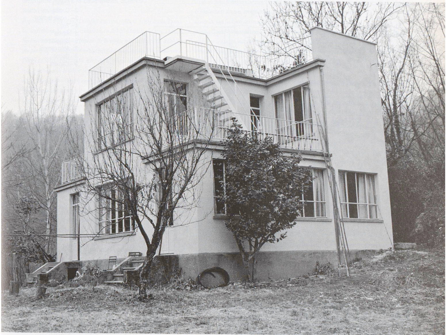
Dopo il restauro, 2000