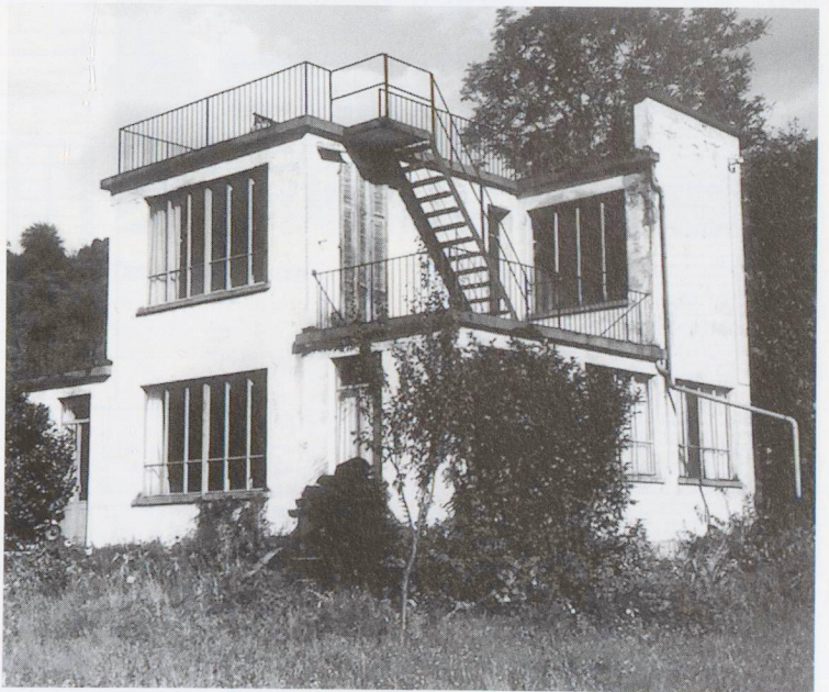
Prima del restauro, 1983