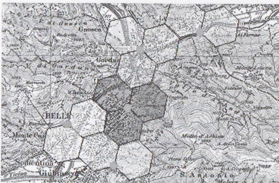
2 - Copertura delle antenne della telefonia mobile

Poiché la capacità di un'antenna è limitata come numero di telefonate in contemporanea, il numero e la grandezza della cella dipende dalla stima dei possibili utenti nell'area considerata.