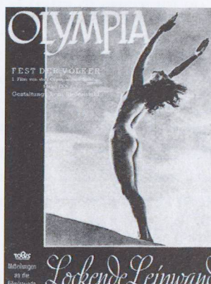
Leni Riefenstahl, locandina del film «Olympia», 1. parte: «Fest der Völker»

Il Consiglio Comunale di Ascona bocchia il credito di 3 milioni di franchi per il restauro del Teatro San Materno, capolavoro del 1928 dell'architetto Carl Weidemeyer. Durante il dibattito, il sindaco Aldo Rampazzi: «Un restauro costa. Certo, se prendiamo una ruspa, con 50 mila franchi risolviamo il problema. Anzi, se aspettiamo ancora un po' non serve nemmeno la ruspa, basta il camion».