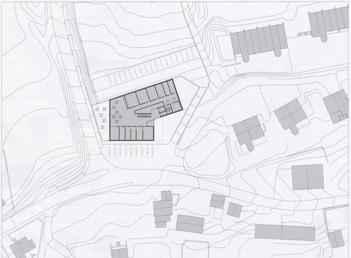
Pianta piano terra