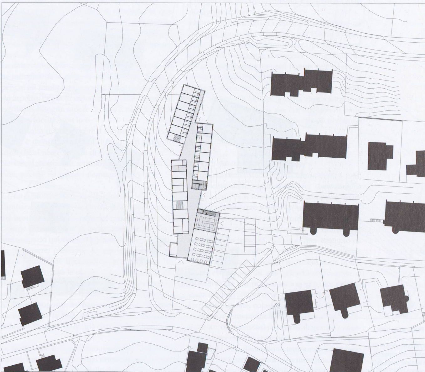
Pianta livello entrata