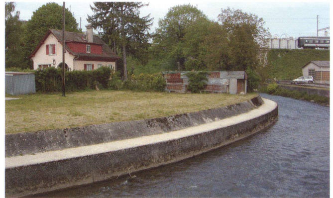
Nelle due fotografie la situazione prima e dopo l'intervento di rinaturalizzazione

Alla luce di queste premesse, al fine di promuovere un progetto di rinaturalizzazione/messa in sicurezza, è stato appositamente costituito un gruppo di lavoro che riunisce diverse autorità cantonali competenti, tra cui quella che si occupa della rinaturalizzazione dei bacini idrici, quella che sovrintende alla protezione della natura e del paesaggio e quella preposta alla tutela di siti e monumenti. Partecipa al progetto anche il comune di Versoix.