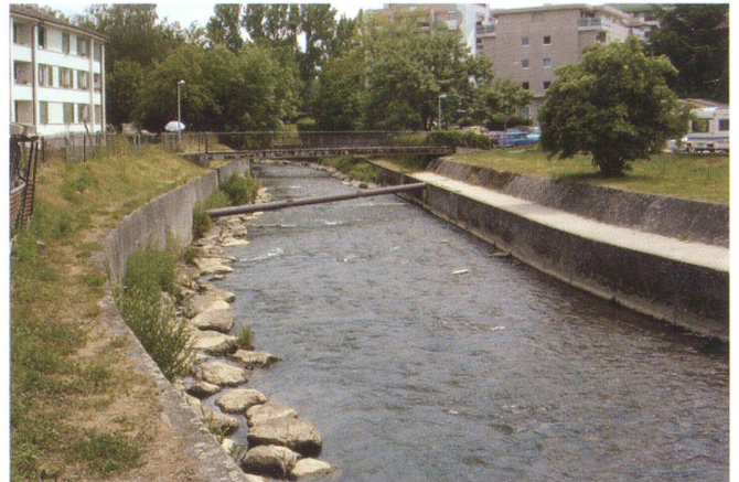
Intervento prima e dopo la rinaturalizzazione del Versoix nei pressi della nuova passerella

Questa iniziativa si inserisce nel vasto programma di rinaturalizzazione dei bacini idrici lanciata dal Cantone di Ginevra nel lontano 1998, e rappresenta uno dei numerosi interventi realizzati sul Versoix, che vanno dall'allestimento di un nuovo delta naturale con spiaggia pubblica nel punto in cui il fiume sbocca nel Lemano (2010) alla demolizione di un'opera di canalizzazione per la pesca e alla riqualificazione delle sponde del tratto delle Usiniers (2008).