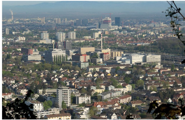
Il quartiere Polyfeld di Muttenz: un esempio di densificazione centripeta qualitativa.

La grande sfida dei progettisti è insita nei numerosi agglomerati risalenti agli anni Cinquanta e Sessanta, edifici che, per la maggior parte, non sono più in grado di soddisfare le attuali esigenze, né dal punto di vista energetico, né per quanto concerne le planime-