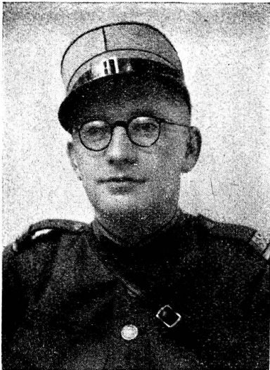
Zensur-Nr. 352 IXa