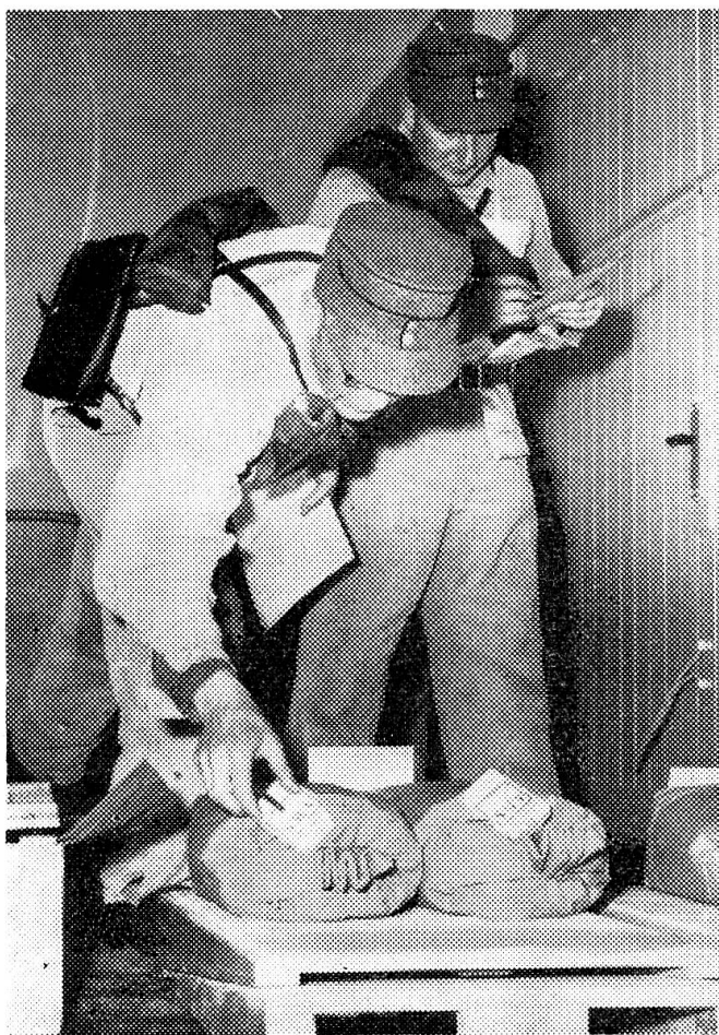
Zwei Wettkämpfer an der Arbeit im Lebensmittelmagazin

Da der Start für die ersten Wettkämpfer auf 07.00 Uhr angesetzt und vorher noch eine 20 Minuten dauernde schriftliche Arbeit zu erledigen war, hiess es am Samstag, den 14. Mai, früh Tagwache in der Kaserne Zürich. Mit Autobussen wurden die Konkurrenten ins Schulhaus Riedhalden in Zürich-Affoltern gebracht, wo die