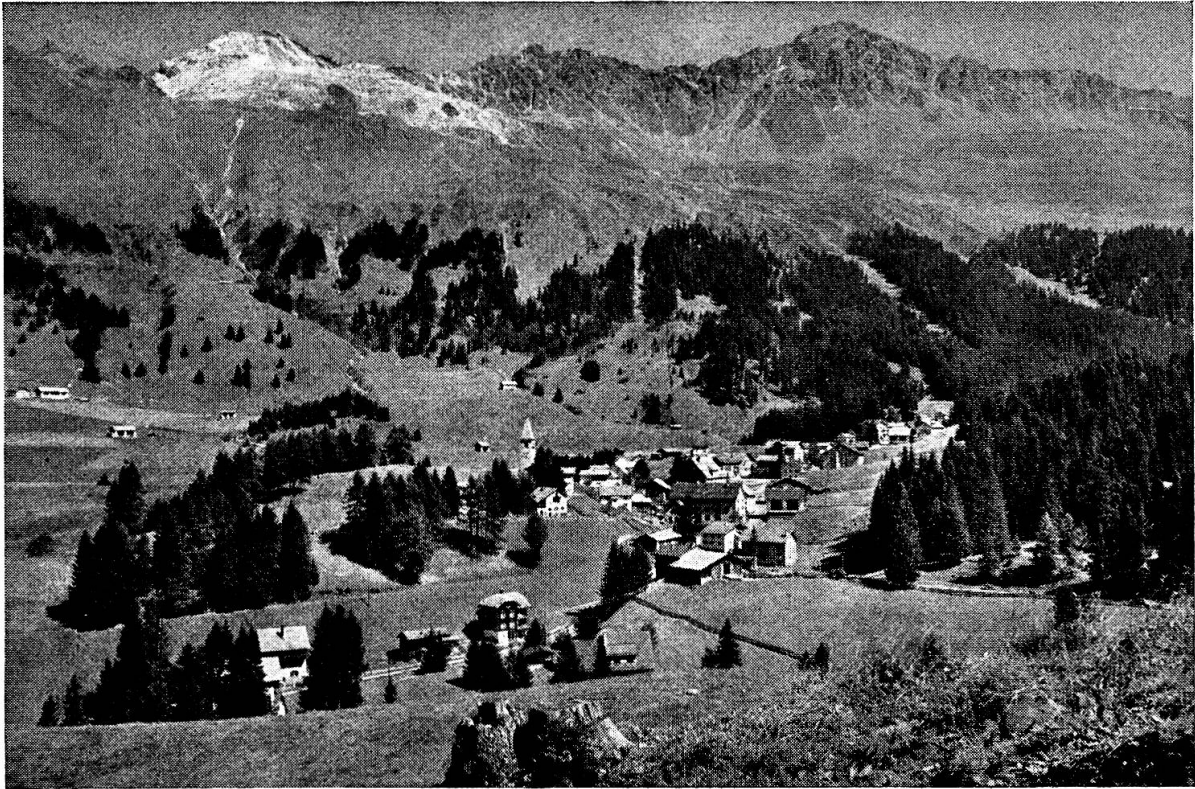
Parpan, der ideale Familienferienort in Mittelbünden

Wir bitten noch folgende Punkte zu beachten: