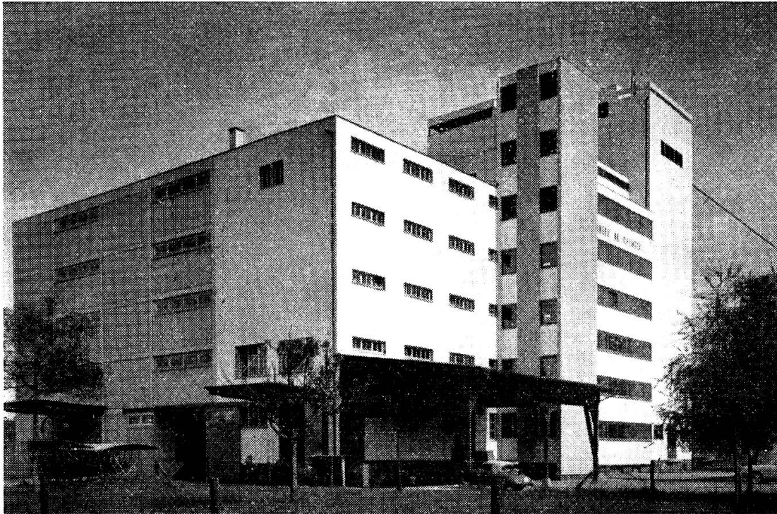
Jules Grüniger AG., Rheineck / SG, Aussenansicht Neubau 1961, Maismühle

zu betrachten. Es stellt sich deshalb die berechtigte Frage: Werden heute noch neue Maismühlen gebaut und wenn ja, weshalb?