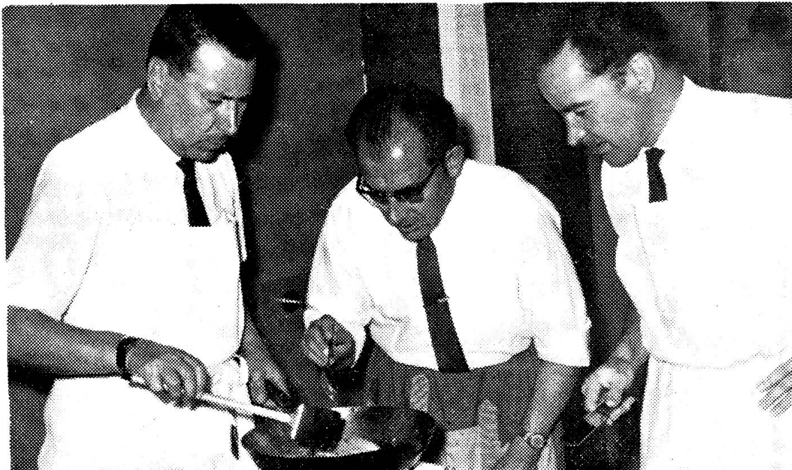
Mit Kennermiene werden die Speisen gewürzt

Wer selber etwas vom Kochen versteht, wird das Essen nicht gedankenlos herunterschlingen, worüber sich unsere Hausfrauen mit Recht beklagen, sondern es mit dem Auge und dem Gaumen eines Kenners, mit schnuppernder Nase und neugieriger Zunge und mit viel Achtung vor der schöpferischen Leistung der Küchenfee genießen. Und last not least: ein Männerkochkurs ist eine äusserst fröhliche Angelegenheit, die zu netten Dauerfreundschaften, zu gelegentlichem Wiedersehen und neuen gastronomischen Taten führt.