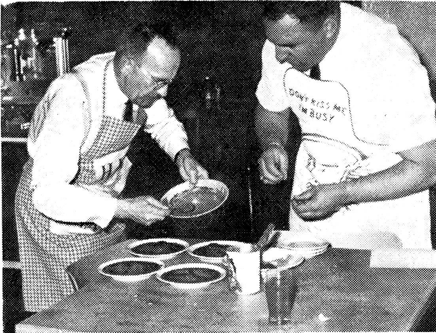
Jünger der Gastronomie beim Anrichten

kurs mit dem Elementaren der edlen Kochkunst vertraut zu machen und später in Fortbildungskursen weitere Kenntnisse zu erlangen. Das alles zu dem lobenswerten Zweck, ein Vertrauensverhältnis zur Kochkelle zu gewinnen, um sie nicht allzu unbeholfen schwingen zu müssen, sollte einmal die Frau Gemahlin unpässlich sein, vielleicht gar auch, um ihr, der Vielgeplagten, im Küchenreich gelegentlich ein freies Weekend zu gönnen. Zu diesem praktischen Nutzen kommt ein ethischer dazu: