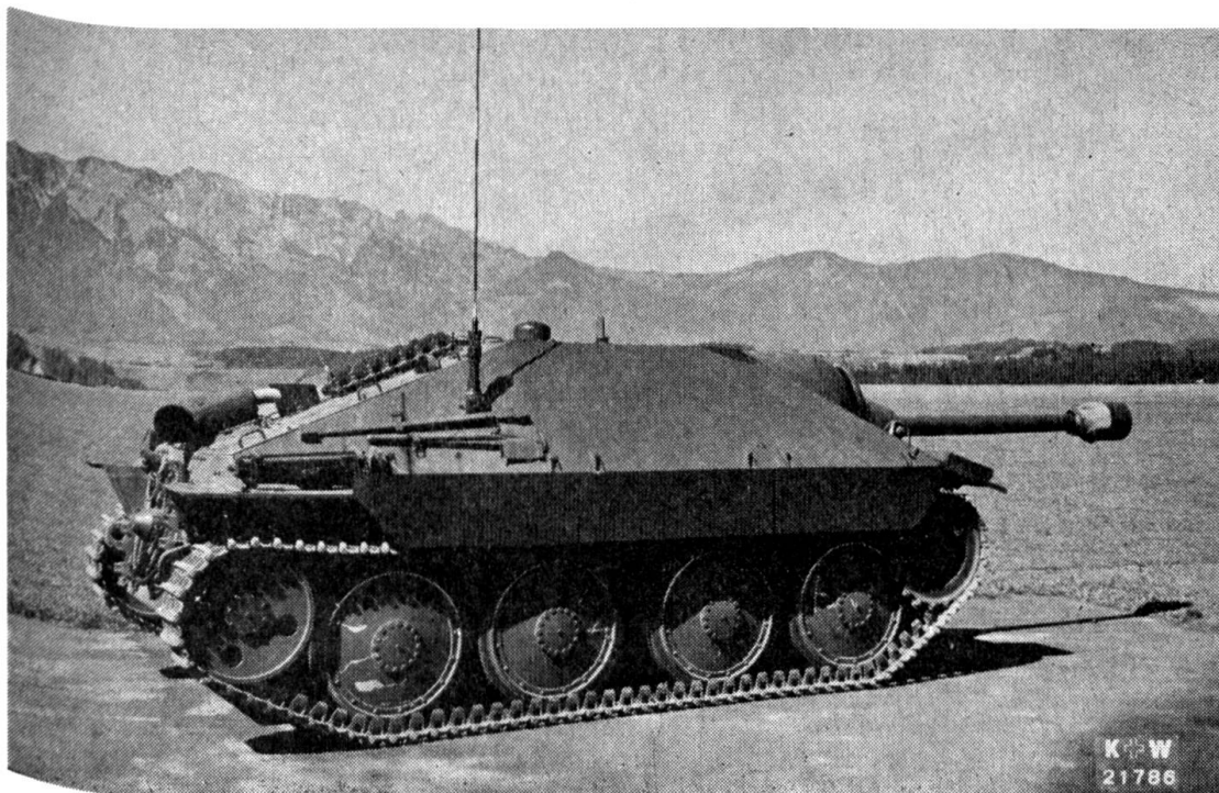
Der Panzerjäger «G-13»