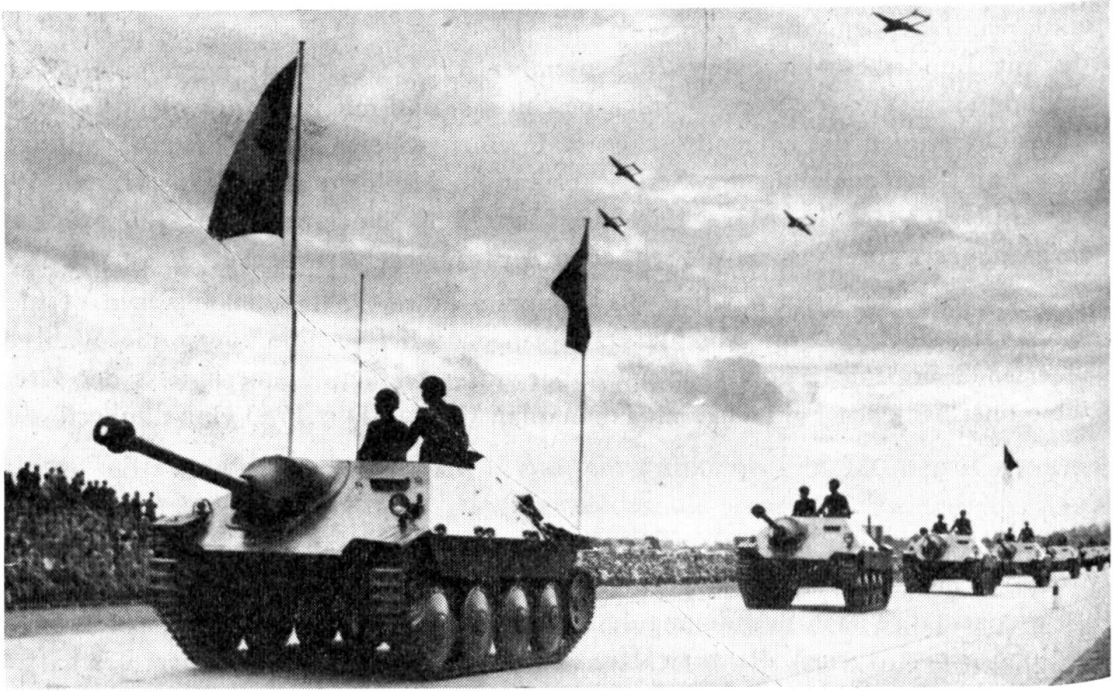
Panzerjäger «G-13» im Defilee