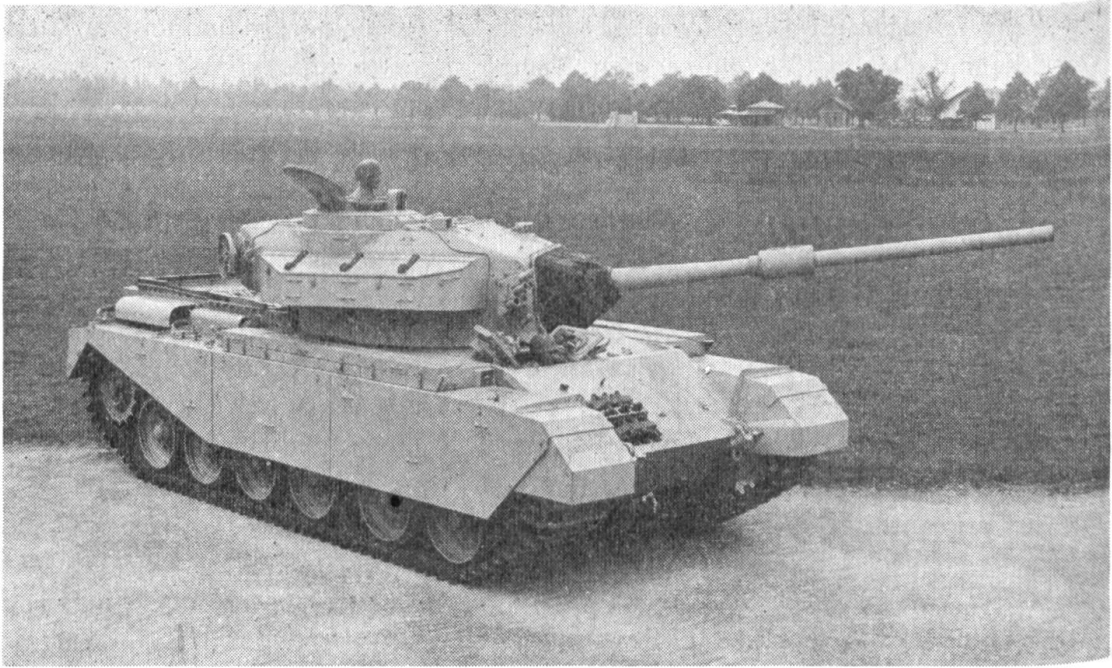
Der mittlere Panzer «Centurion Mk. III» mit dem 8,4-cm-Geschütz

Für den Bahntransport des «Centurion» haben die SBB einen besonderen Transportwagen entwickelt. Mit dem Bahntransport können grössere Panzerverschiebungen auf der Strasse und damit Störungen des Verkehrsnetzes vermieden werden.