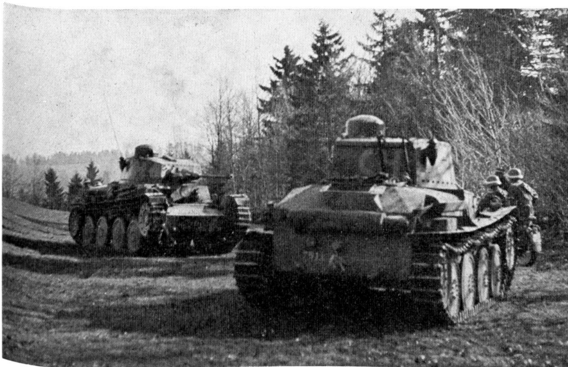
Mit dem 8,5 Tonnen schweren «Praga» hat unsere Armee im Aktivdienst geübt

Mit der Beschaffung mittelschwerer Panzer konnte erst im Frühjahr 1955 begonnen werden, nachdem eine besonders eingesetzte Panzerbeschaffungskommission den Ankauf des in Korea bewährten 50,5 Tonnen schweren britischen Panzers « Centurion » vorgeschlagen hatte. Diesem Antrag schlossen sich Bundesrat und eidgenössische Räte an. Eine erste Serie von 100 Stück des Typs « Centurion Mk. III » wurde vom Mai 1955 hinweg geliefert, und die Beschaffung einer zweiten Hunderter-Serie des etwas verbesserten Typs