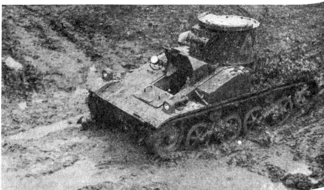
Der 4 Tonnen schwere «Vickers» ist der Veteran der schweizerischen Panzerfahrzeuge

Nachdem in den Fünfzigerjahren bei uns eine sehr ausgiebige Diskussion über die Panzerfrage gewaltet hatte, fassten die eidgenössischen Räte anlässlich der Genehmigung des