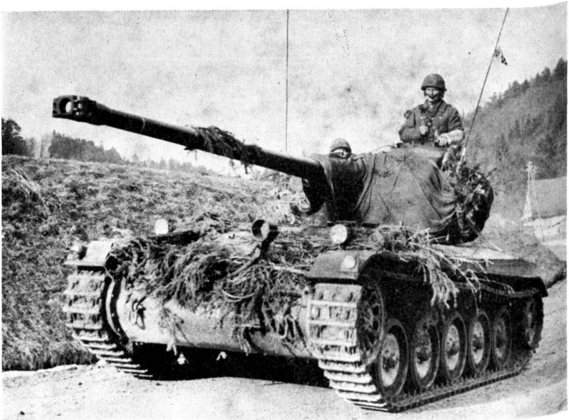
Der «Leichte Panzer 51» ist ein sehr geeignetes Aufklärungsfahrzeug