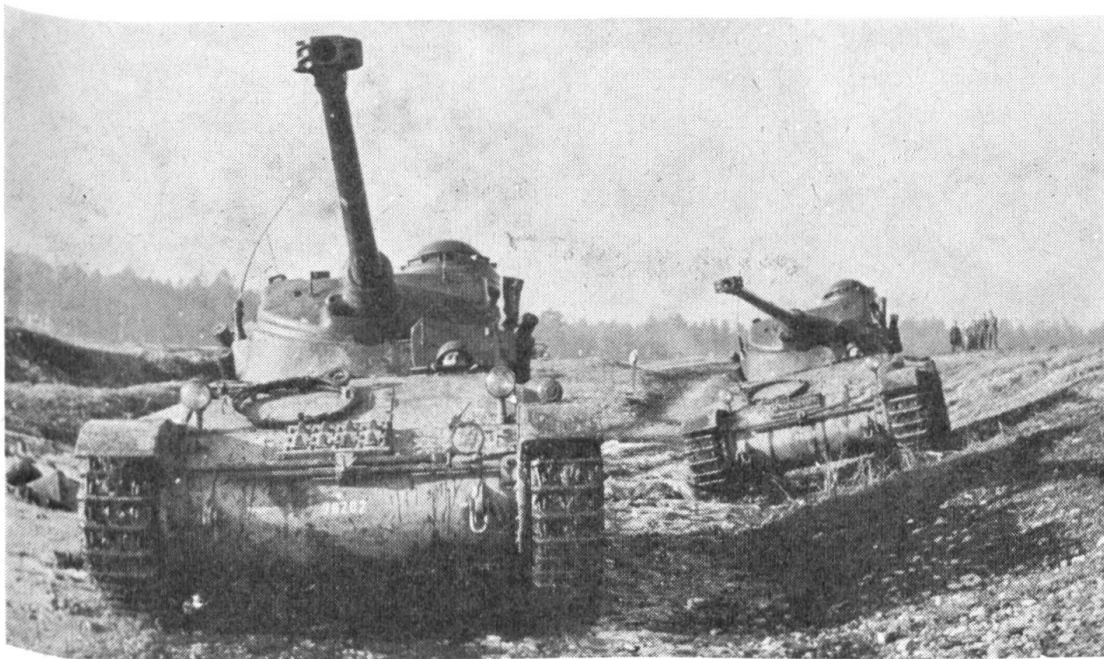
Der Leichtpanzer 51 auf Versuchsfahrt