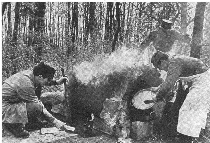
Der «Korea-Ofen», eine aus einem Blechfass und Erde gebastelte Feuerstelle, die erstaunlich leistungsfähig ist und sofort wieder vernichtet werden kann.