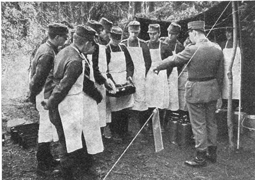
Feldmässiges Kochen. Eine Klasse angeheher Kü. Chef-Uof. hat ein Kochzelt erstellt und übt nun das feldmässige Kochen mit Kochkisten.

Instruktionen am Benzinvergaserbrenner. Sämtliche Angaben auf den Planskizzen sind zwei- oder dreisprachig. Von den fünf Schulen im Jahr sind zwei dreisprachig.