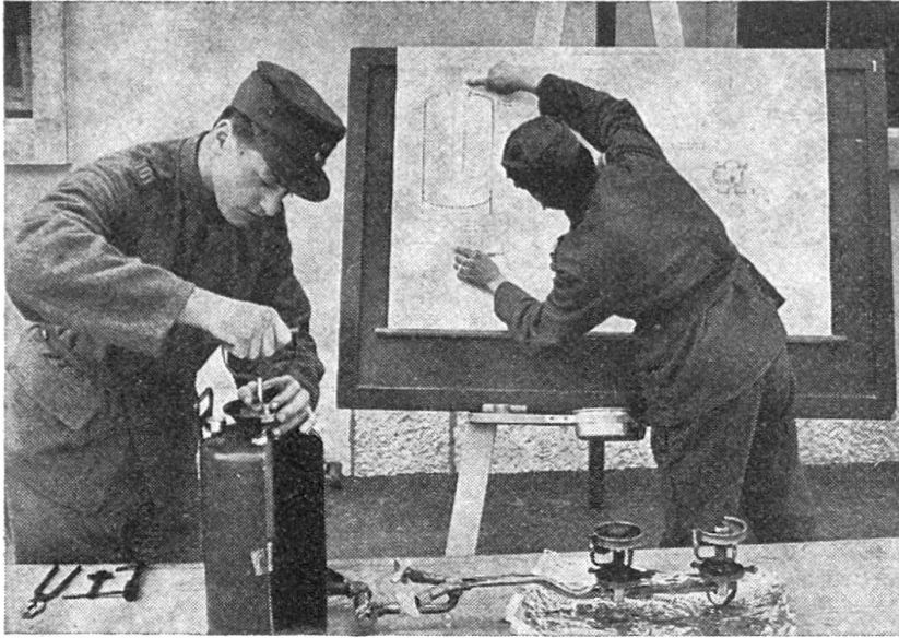
Küchenchef in der Ausbildung

Instruktionen am Benzinvergaserbrenner. Sämtliche Angaben auf den Planskizzen sind zwei- oder dreisprachig. Von den fünf Schulen im Jahr sind zwei dreisprachig.