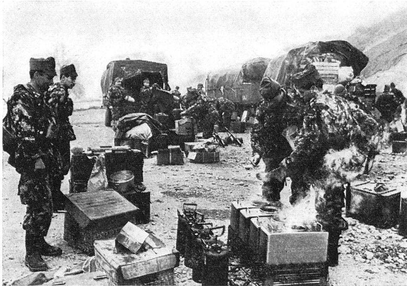
Kochkisten im Einsatz

Die Kochkiste hat sich bis heute sehr gut bewährt, es gilt jedoch, dieselbe zweckmässig einzusetzen und auch entsprechend zu behandeln.