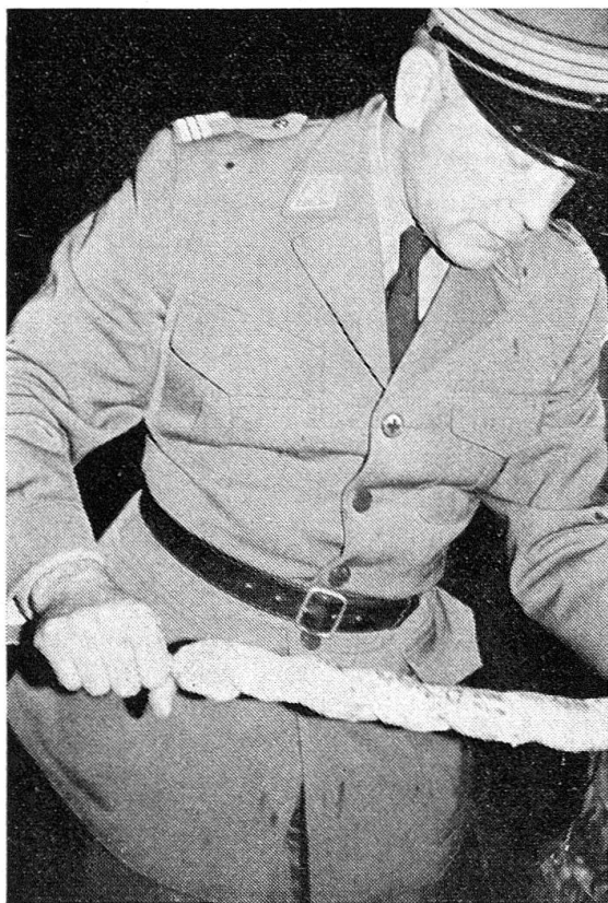
Ob das Backwerk wohl trotz Regen gelingt?