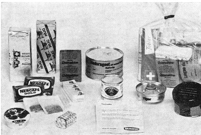
Kampfportion Typ C ca. 3500 Kalorien