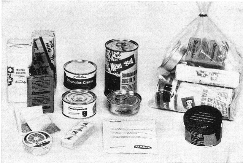
Die neue Kampfportion