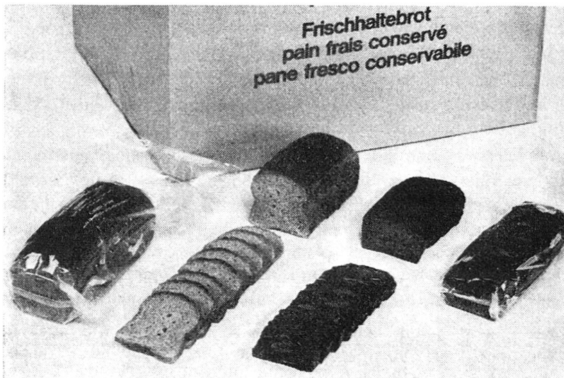
Die neue Brotkonserve, ein Frischhaltebrot

Notportion bestehend aus Spezial- schokolade