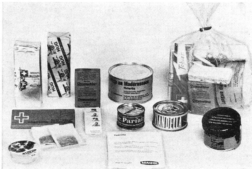
Kampfportion Typ B ca. 3100 Kalorien