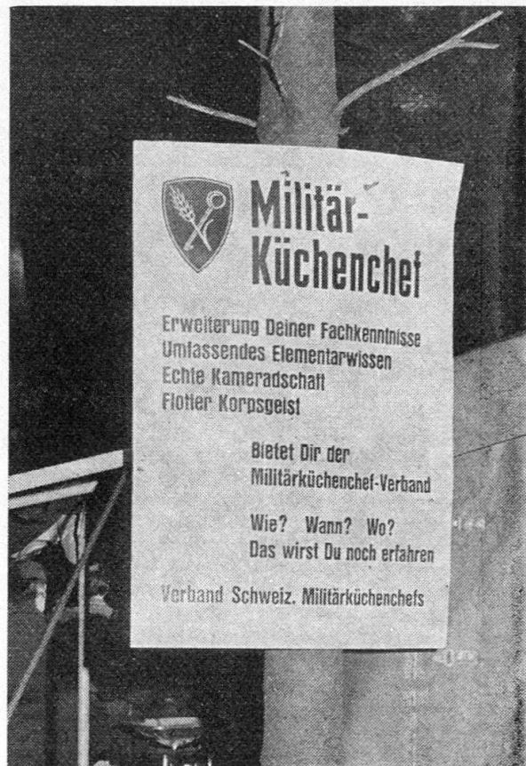
Werbung der Küchenchefs