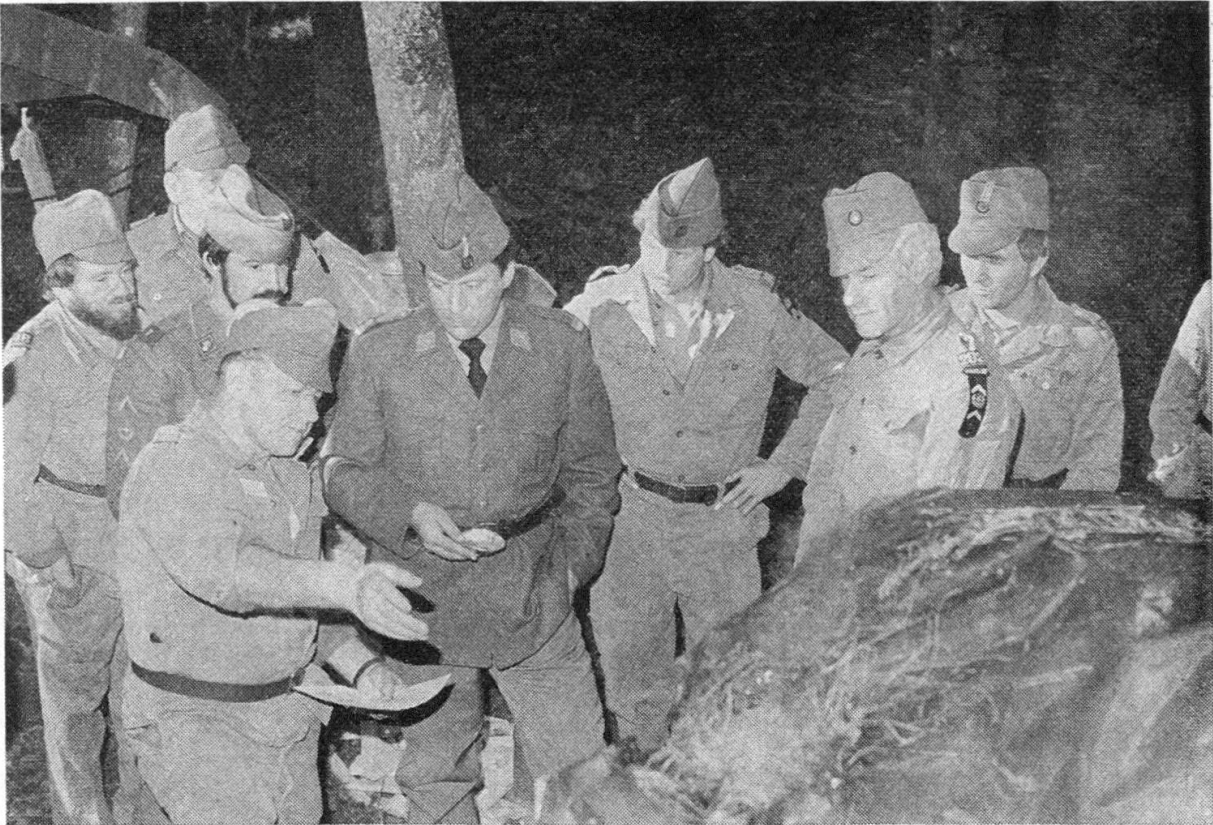
Erklären des Koreaofens