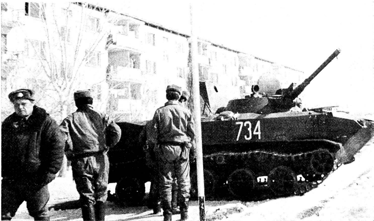
Panzer vor Wohnblock in Kabul / Afghanistan

1. Eindrücklicher als alle mahnenden Worte hat im vergangenen Jahr die Entwicklung der internationalen Lage die Notwendigkeit einer dauernden und vollen Wehrbereitschaft deutlich gemacht. Das Jahr begann mit dem Donnerschlag der sowjetischen Invasion in Afghanistan, dessen gefährliche Besonderheit darin bestand, dass es sich bei diesem Feldzug gegen einen ausserhalb des östlichen Militärbündnisses stehenden Staat nicht mehr wie bisher um einen «Stellvertreterkrieg» handelte, da die Sowjetunion mit ihren eigenen Kräften den Angriff gegen Afghanistan führte. Neben dem