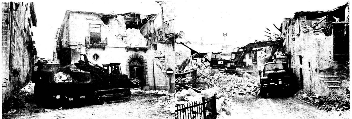
Bilder vom Erdbebengebiet Italien

Einen Sonderfall des Einsatzes von Militärpersonen zu nicht militärischen Zwecken lag in der Tätigkeit von Angehörigen der Luftschutz- und Genietruppen als Verstärkung des schweizerischen Katastrophenhilfskorps im südtalienenischen Erdbebengebiet . Der Einsatz erfolgte freiwillig und ohne Anrechnung auf die Dienstpflicht in der Armee.