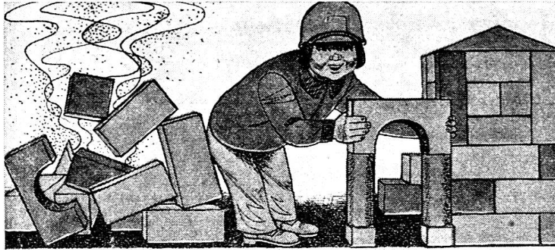
«Was kümmern mich meine Aufbauerfolge von gestern?»

«Eulenspiegel», Ostberlin, Nr. 14 und 15/1981