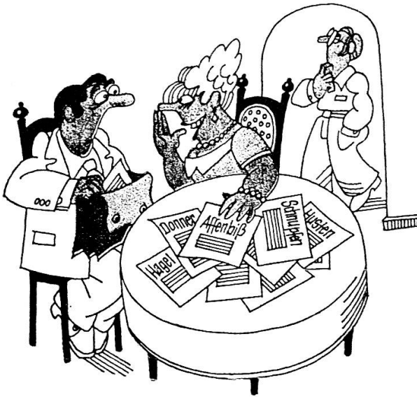
Die Frage an den Versicherungsexperten: «Mein Mann will morgen in seinem Kollektiv Massnahmen ergreifen. Schliessen Sie auch dafür Rückversicherungen ab?» (Die Werktätigen müssen zwar parieren, aber renitent sind sie doch.)