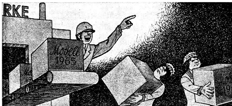
Wenn 1981 die Modelle von 1965 produziert werden: «Aber wie wir's produzieren, das ist ganz modern!»