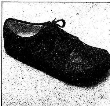
Modell 332 «Elegant» in den Farben burgund, mittelbraun, anthrazit, écru, schwarz und nubuk sand.