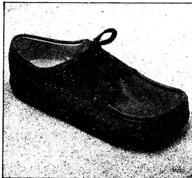
Modell 353 «Rustikal» in den Farben natur, dunkelbraun, marineblau und schwarz.

Ihre Zehen haben Platz, Ihr Fuss hat festen Halt. Sie laufen bequem und sicher. Nichts drückt, nichts schmerzt. Sie vergessen fast, dass Sie Schuhe tragen. Es ist wie Barfussgehen. Trotz der anatomisch richtigen fussgerechten Form sind 'jacoform' Bequem-Schuhe sportlich-chic.