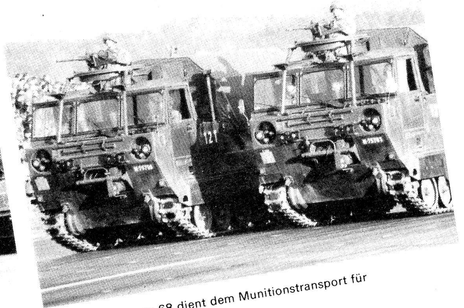
Der Raupenpanzer 68 dient dem Munitionstransport für die Panzerartillerie.