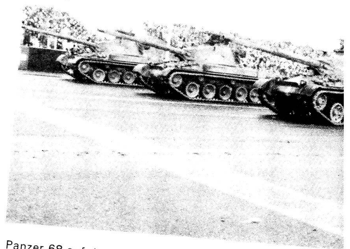
Panzer 68 auf der Defilierstrecke in Dübendorf.

Militärattachées aus aller Welt wollen sich über die Stärke unserer Armee informieren.